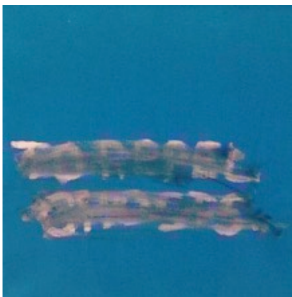
J.M. Basquiat - To Rebel Ghosts