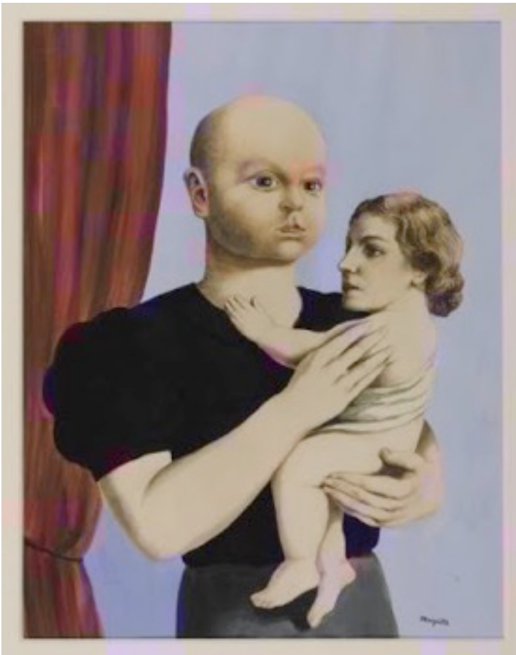
René Magritte. L'Esprit de la Géométrie

Giorgio Colli - Filosofia dell'espressione