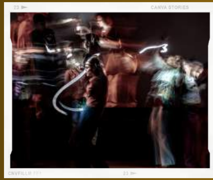
CANVA STORIES CNVFILLM 111 23