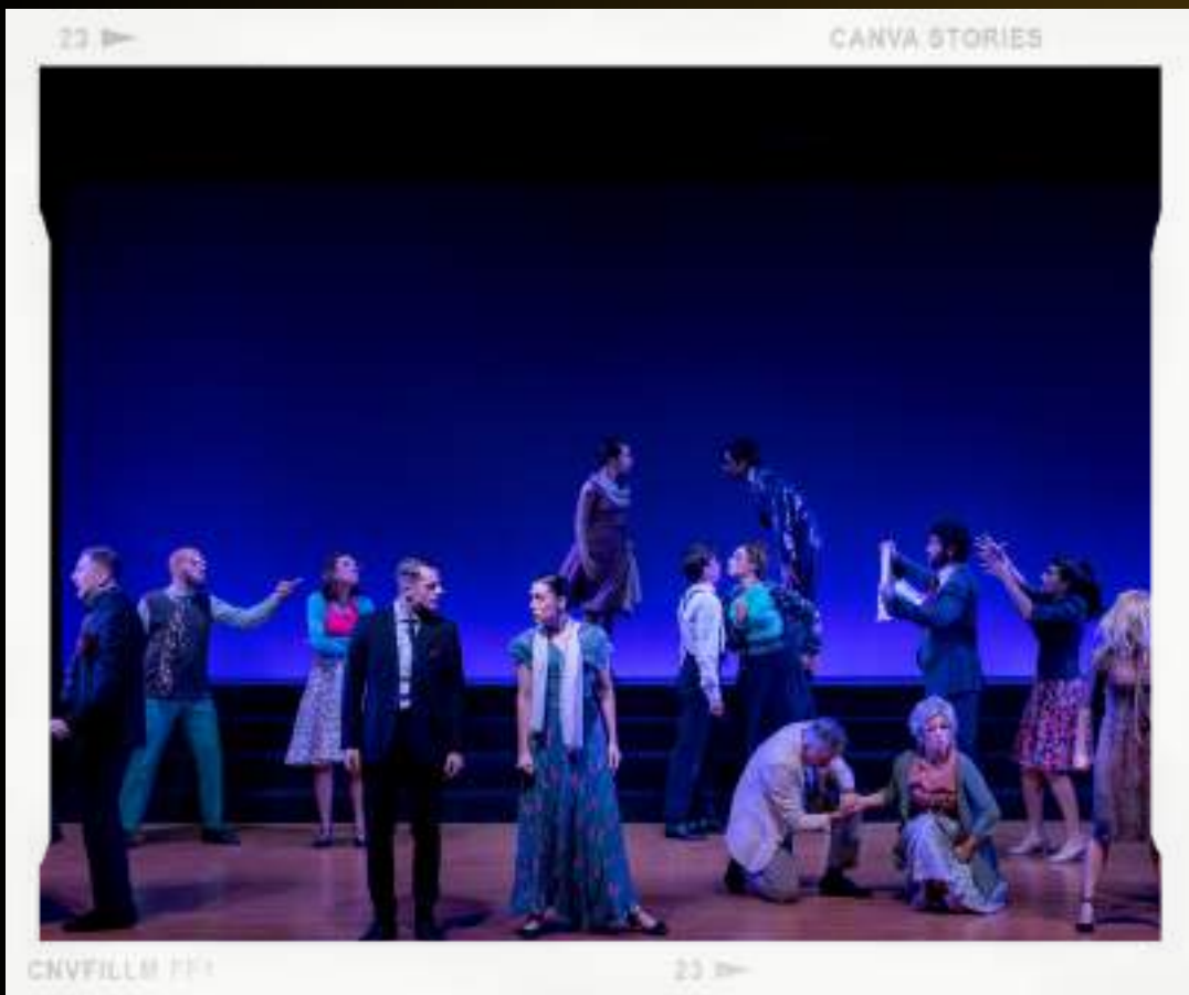
CANVA STORIES CNVFILLM 111 23