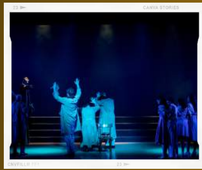
CANVA STORIES CNVFILLM 111 23