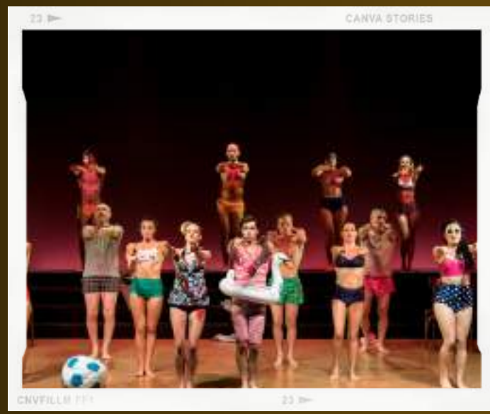
CANVA STORIES CNVFILLM 111 23