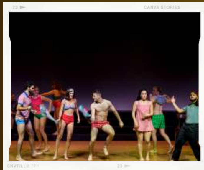
CANVA STORIES CNVFILLM 111 23