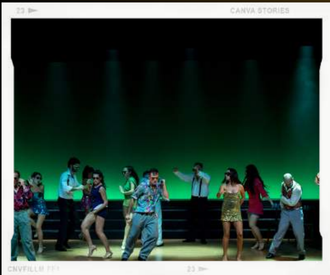
CANVA STORIES CNVFILLM 111 23