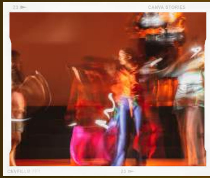
CANVA STORIES CNVFILLM 111 23