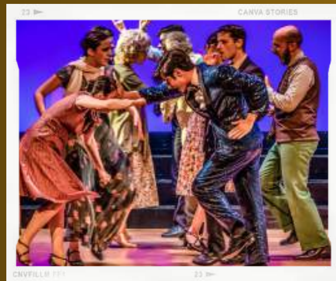
CANVA STORIES CNVFILLM 111 23