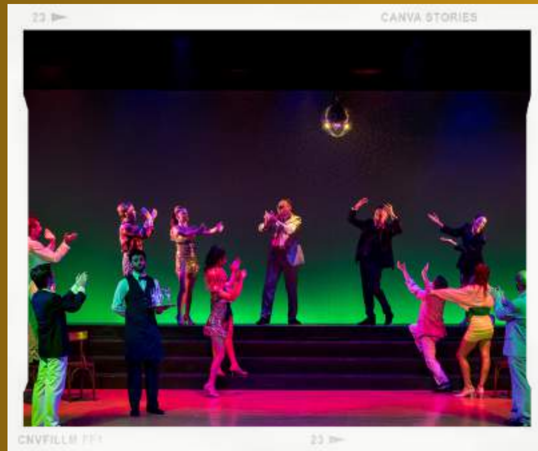
CANVA STORIES CNVFILLM 111 23