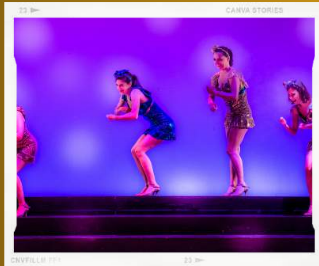
CANVA STORIES CNVFILLM 111 23