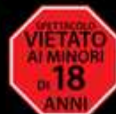
ILLUSTRAZIONE DEL PROGETTO

A NAKED LOVE è un'opera teatrale per adulti.